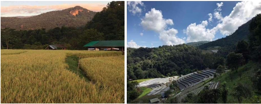
ภาพที่ 5 นาขั้นบันไดชุมชนบ้านแม่กลางหลวง อำเภอจอมทอง จังหวัดเชียงใหม่

ภายในชุมชนบ้านกลางหลวงได้มีการจัดกิจกรรมการท่องเที่ยวภายในชุมชน เป็นกิจกรรมที่มีความเกี่ยวข้องกับวิถีชีวิตและภูมิปัญญาของกลุ่มชาติพันธุ์ ที่ยังคงมีการสืบทอดกันมาอยู่ในปัจจุบัน เช่น พิธีกรรมบวชป่า พิธีกรรมผูกข้อมือ หรือพิธีกรรมสู่ขวัญ เป็นต้น และกิจกรรมที่เกี่ยวข้องกับธรรมชาติ เช่น การชมนาขั้นบันได ซึ่งเป็นการทำนาบนพื้นที่สูง ด้วยการปรับพื้นที่หน้าดินที่เคยใช้ปลูกพืชชนิดอื่นมาก่อน เพื่อผลผลิตและสร้างความมั่นคงทางอาหารบนพื้นที่สูง ทั้งนี้ นาขั้นบันไดบ้านแม่กลางหลวงจะแบ่งออกเป็น 2 ช่วง เดือนกันยายน-กลางเดือน ตุลาคม จะเป็นช่วงหน้าฝนที่ค่อนข้างจะชุ่มฉ่ำ และปลายตุลาคม-ต้นพฤศจิกายน เป็นช่วงที่ข้าวเริ่มออกรวงเป็นสีทอง อีกทั้งนักท่องเที่ยวที่มาชมนาขั้นบันไดยังสามารถเข้าร่วมกิจกรรมทำนากับทางชุมชนได้ตลอดทั้งวัน ดังภาพ (ไปด้วยกัน, 2564)