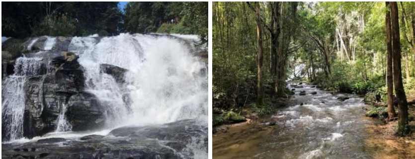
ภาพที่ 6 น้ำตกผาดอกเสี้ยว แหล่งศึกษาธรรมชาติบ้านแม่กลางหลวง อำเภोजอมทอง จังหวัดเชียงใหม่ ที่มา: ผู้เขียน (2563)

นอกจากนี้ยังมีเส้นทางศึกษาธรรมชาติ มีระยะทางประมาณ 2.6 กิโลเมตร ในระหว่างเส้นทางนั้นก็จะมีความสวยงามของน้ำตกผาดอกเสี้ยวขนาด 10 ชั้น โดยชั้น 7 เป็นจุดเด่นและต้นกำเนิดของน้ำตกรักจัง จากภาพยนตร์รักจังที่เคยมาถ่ายทำ ณ สถานที่แห่งนี้ ระหว่างที่ชมน้ำตกผาดอกเสี้ยวก็จะมีสะพานไม้ไว้ข้ามลำธาร ทำให้เห็นทิวทัศน์ของน้ำตกที่ตกลงมาอย่างสวยงาม นอกจากนี้ยังมีพืชพรรณธรรมชาติ และนกหลากหลายสายพันธุ์ตามเส้นทางที่ลัดเลาะไป รวมถึงร้านกาแฟสด จากบ้านแม่กลางหลวง หลังจากเดินชมเส้นทางธรรมชาติก็พบกับร้านกาแฟที่อยู่บนเนินเขา ลักษณะเป็นเพิงหรือศาลานั่งพักผ่อน โดยจะมีสาธิตการชงกาแฟ เป็นแบบใช้ถุงกาแฟไม่ได้ใช้เครื่องชงแต่อย่างใด และการคั่วกาแฟ พร้อมผลิตภัณฑ์ที่สามารถซื้อกลับไปเป็นของที่ระลึกได้ ดังภาพ (พัชรนันท์ คงเจริญ, 2559)