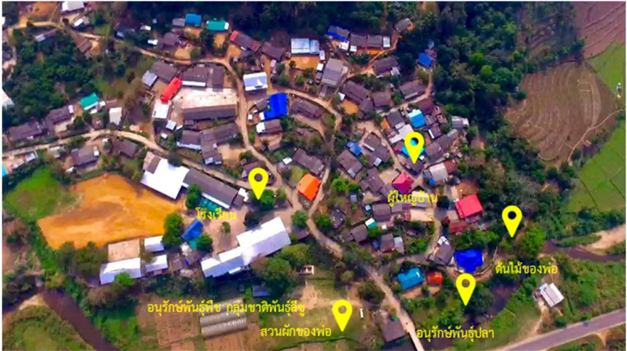
ภาพที่ 2 แผนที่หมู่บ้านปางสา

ที่มา: (สุพจน์ หลีจา, เอกสารสำเนา 5 มกราคม พ.ศ. 2561)