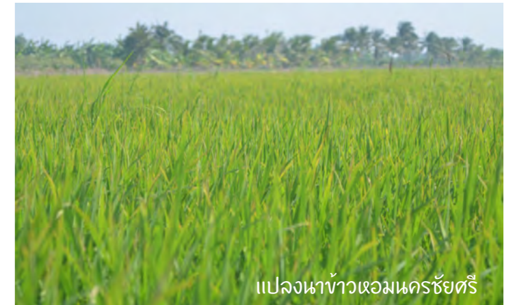
แปลงนาข้าวหอมนครชัยศรี

19 “โรงเรียนบ้านคลองสว่างอารมณ์” รอบรั้วโรงเรียนแห่งนี้ เป็นอีกแห่งสายใยความผูกพันที่เต็มไปด้วยเรื่องราวของคนลานตากฟ้า-คลองโยง มาตั้งแต่รุ่นลูกป่าน้ำอาจจนถึงรุ่นลูกหลาน และที่นี่ยังมีพิพิธภัณฑ์เครื่องมือเครื่องใช้การเกษตรและสะพานไม้เก่า ที่บอกเล่าโดยยุวมัคคุเทศก์