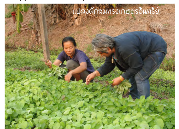
แปลงผักสมทรงเกษตรอินทรีย์

18 “สมทรงเกษตรอินทรีย์” เยี่ยมชมแปลงผักพืชสวนเกษตรอินทรีย์ ที่เกิดขึ้นจากความตั้งใจของคนที่ไม่ได้เกิดที่นี่ แต่มีหัวใจอยากตอบแทนผืนดินอาทิตย์ จนกลายเป็นพื้นที่เรียนรู้ดูงานที่หลากหลายกลุ่มมาเยี่ยมชม