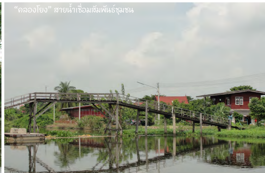
“คลองโยง” สายน้ำเชื่อมสัมพันธ์ชุมชน

3 “บ้านสวนสุขสบาย 1” แดะที่ตั้งแห่งหนึ่งเพราะมีถึงสองแห่ง จุดหักเหจากหน้าท่วมใหญ่ครั้งประวัติศาสตร์ในปี พ.ศ.2554 จากสวนกล้วยไม้สู่สวนแครกาศี และพืชอากาศอีกหลายชนิด เช่น ทิลแลนด์เซีย เดรป และพุดคุดกับเจ้าของสวนคนรุ่นใหม่กับการตัดสินใจกลับบ้านครั้งสำคัญ