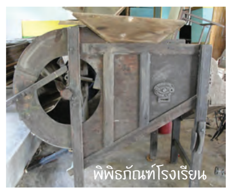
พิพิธภัณฑ์โรงเรียน

15 “สินชัยแปลงนาอินทรีย์” ลานตากฟ้า-คลองโยง แห่งทุ่งนครชัยศรีเต็มไปด้วยนาข้าว และนาแปลงหนึ่งที่เราไม่ควรจะพลาดไปเยี่ยมชมและพูดคุยกับเจ้าของนาแปลงแรก ที่ผันตัวเองจากนาเคมีมาเป็นนาอินทรีย์พันธุ์ “ข้าวหอมนครชัยศรี” ทั้งที่ตัวเองก็ไม่เคยทำมาก่อน แต่ก็พบข้อดีของข้าวพันธุ์พื้นถิ่นว่าเติบโตได้ดีและทนต่อโรค