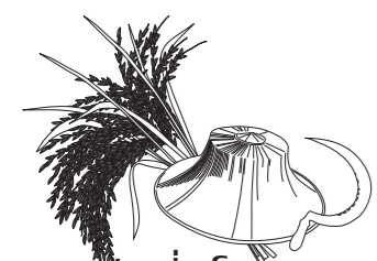
ก่อตั้งโดยชุมชน “ลานตากฟ้า-คลองโยง”

โทร. 0875522262 เฟซบุ๊ก: กลุ่มวิสาหกิจ ชุมชนบ้านโหนดชุมชน ลานตากฟ้า