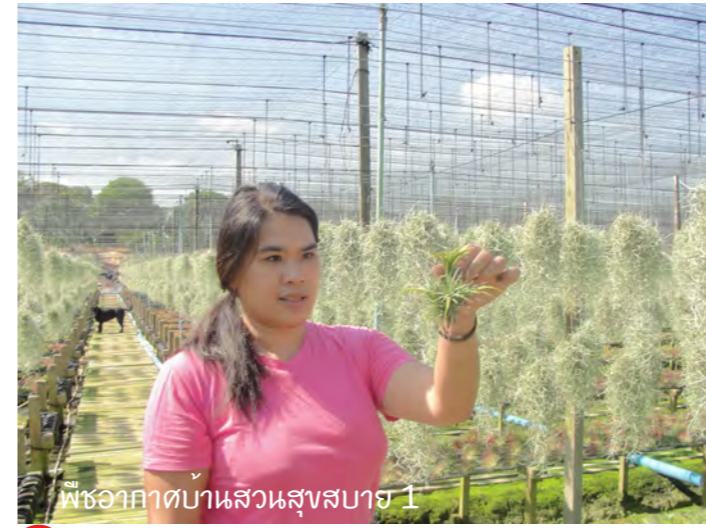
พืชอากาศบ้านสวนสุขสบาย 1