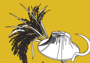
ก่อตั้งโดยชุมชน “ลานตากฟ้า-คลองโยง”

จัดทำโดย โครงการ รูปแบบการท่องเที่ยววิถีเกษตรกรรม: ชุมชน “ลานตากฟ้า-คลองโยง” จ.นครปฐม