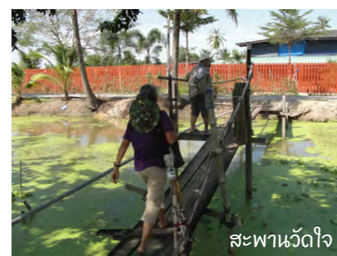
สะพานวัดใจ

12 “บ้านนาข้าวสวนผัก” บ้านนาข้าว-สวนผักร้างแดงริมคลองบางสะบ้าแห่งนี้ก็เป็นอีกแห่งที่ไม่ควรพลาดความท้าทายแรกก่อนเข้าบ้านนี้คือ “สะพานวัดใจ” ที่ทอดยาวข้ามคลองยามเดินจะเกิดอาการยวบยาบให้ตกใจเล่นแต่ไม่ต้องกังวลไปแม้จะแอนแคไชน ก็ยังรับน้ำหนักเราได้อยู่