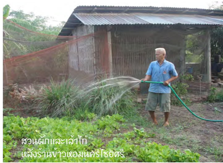
สวนผักและลำไ้ หลังร้านข้าวหอมนครชัยศรี