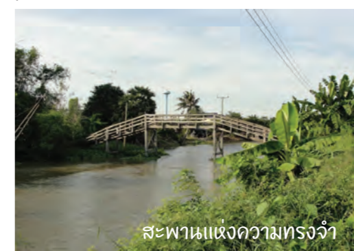
สะพานแห่งความทรงจำ