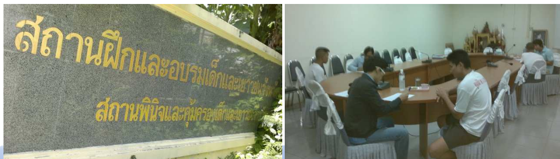
การเข้าเก็บข้อมูลจากกลุ่มเยาวชนที่มีภูมิปัญญาในจังหวัดสมุทรสาคร จากสถานฝึกและอบรมเด็กและเยาวชนจังหวัดราชบุรี