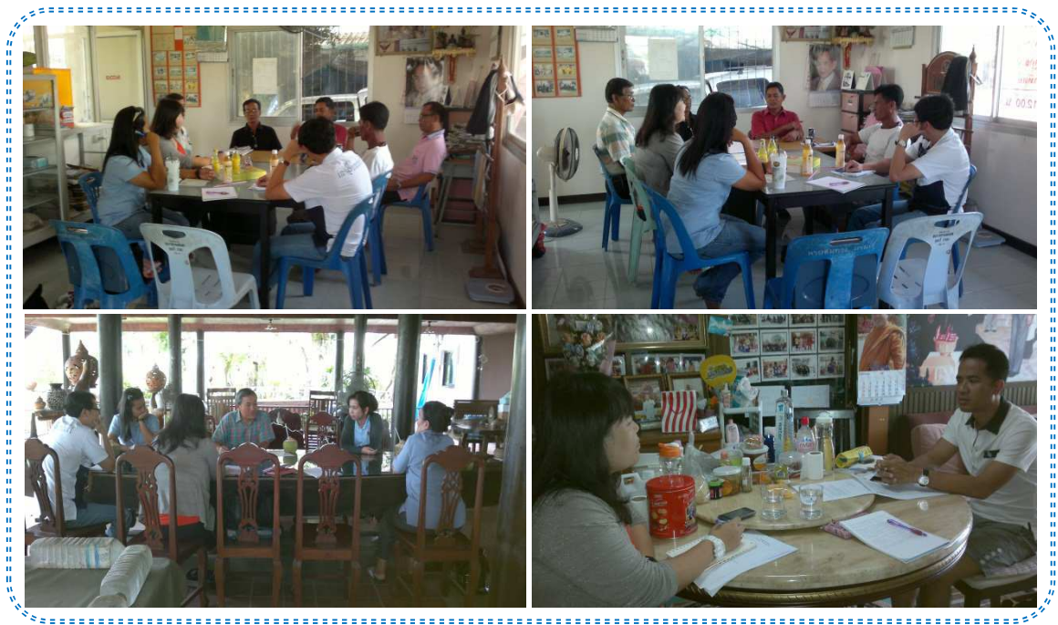
การเข้ารับฟังสถานการณ์ด้านแรงงาน และแรงงานต่างด้าว จากผู้ใหญ่บ้าน และผู้นำชุมชน ในพื้นที่อำเภอเมือง จ.สมุทรสาคร