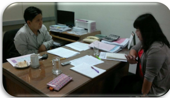
การเข้ารับฟังบรรยายสรุปสถานการณ์ด้านแรงงาน และแรงงานต่างด้าว จากเจ้าหน้าที่ศูนย์อำนวยการพลังแผ่นดินเอาชนะยาเสพติด จ.สมุทรสาคร