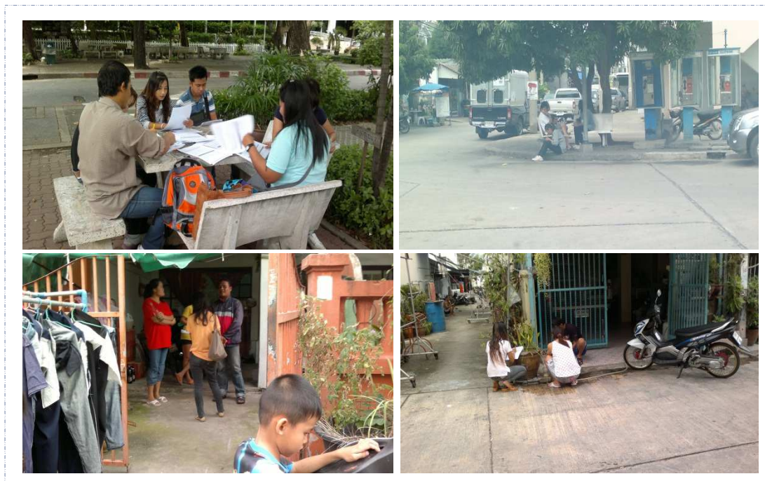
การเข้าสำรวจข้อมูลสถานการณ์ด้านแรงงาน และแรงงานต่างด้าว ภายในชุมชนต่างๆ ของจังหวัดสมุทรสาคร