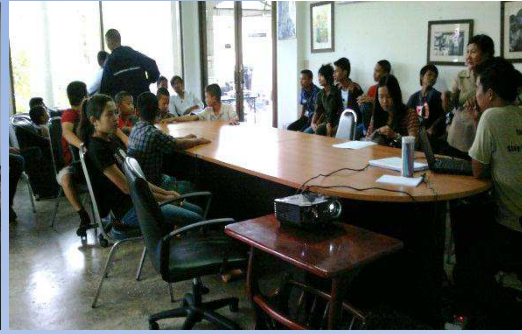
การเข้ารับฟังบรรยายสรุปสถานการณ์ด้านแรงงาน และแรงงานต่างด้าว และเข้าร่วมสังเกตการณ์กลุ่มเยาวชนต่างด้าวที่เข้ามาร่วมทำกิจกรรม กับมูลนิธิเครือข่ายส่งเสริมคุณภาพแรงงานจังหวัดสมุทรสาคร