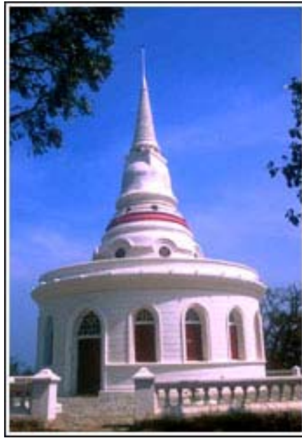
เจดีย์วัดอัมรินทร์นิมิตร

การจัดกิจกรรมท่องเที่ยวตามรอยเบื้องพระยุคลบาท ควรจัดในช่วง เดือนกรกฎาคมถึงกันยายน เพราะเป็นช่วงเดียวกันกับการจัดกิจกรรมชมวังจุฬา ตุช เพราะนอกจากผู้มาท่องเที่ยวจะได้ทราบถึงพระมหากรุณาธิคุณของ พระบาทสมเด็จพระจุลจอมเกล้าเจ้าอยู่หัวที่มีต่อชาวเกาะสีชัง แล้วยังได้ทราบ ประวัติศาสตร์ของเกาะสีชังอย่างครบถ้วนในเวลาเดียวกัน