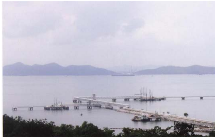
จุดชมวิวของเกาะสีชัง

ค้างคาว และเกาะท้ายตาหมื่น ยังมีแนวปะการังค่อนข้างสมบูรณ์ รวมถึงสัตว์ทะเลอื่นๆ เช่น เม่นทะเลดำ หอยนางรม ปลาทะเลต่างๆ จึงถือเป็นจุดดึงดูดนักท่องเที่ยวที่ชื่นชอบกีฬาตกปลา