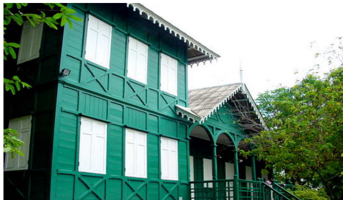
พระราชวังในรัชกาลที่ 5

ค้างคาว และเกาะท้ายตาหมื่น ยังมีแนวปะการังค่อนข้างสมบูรณ์ รวมถึงสัตว์ทะเลอื่นๆ เช่น เม่นทะเลดำ หอยนางรม ปลาทะเลต่างๆ จึงถือเป็นจุดดึงดูดนักท่องเที่ยวที่ชื่นชอบกีฬาตกปลา