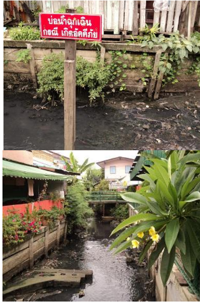
คลองบริเวณชุมชนสวนหลวง 1

ดังนั้น การจะเป็นชุมชนน่าอยู่ หรือเมืองน่าอยู่จะต้องเป็นเมืองที่ประชาชนมีสุขภาพดี มีสภาพแวดล้อมที่ดี มีมลภาวะน้อยที่สุด ตลอดจนมีความสัมพันธ์อันดีระหว่างประชาชน และเปิดโอกาสให้ประชาชนในชุมชนเข้ามามีส่วนร่วมในการจัดการเรื่องที่เกี่ยวข้องกับสภาพแวดล้อม และคุณภาพชีวิตให้มากที่สุด ซึ่งลักษณะของเมืองน่าอยู่ตามที่องค์การอนามัยโลกระบุไว้ด้านกายภาพ สรุปได้ว่า มีการรักษาความสะอาดในด้านกายภาพ สิ่งแวดล้อม และที่อยู่อาศัยอย่างมีคุณภาพ มีระบบนิเวศน์ที่คงอยู่อย่างสมดุลและยั่งยืนนาน ชุมชนมีความเกื้อกูลและไม่เอาวัดเอาเปรียบซึ่งกันและกัน ทั้งนี้ ชุมชนสวนหลวง 1 เป็นชุมชนมุสลิมที่มีความร่วมมือกันระหว่างชาว