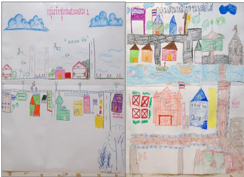
ภาพ 5 วาดชุมชนในอนาคต จากการประชุมกลุ่มด้วยกระบวนการ AIC

จากบันไดคุณภาพชีวิต (bamboo ladder) ภาพรวมความเหลื่อมล้ำทางสังคม พบว่า ชาวชุมชนมองภาพความเป็นชุมชนในอดีตจากคะแนนเต็ม 10 น่าจะอยู่เพียง 4.03 ปัจจุบันเพิ่มขึ้นเป็น 5.03 และอนาคต คาดว่าจะมีความเป็นอยู่ที่ดีขึ้นถึงระดับ 7.17 ดังภาพวาดชุมชนของกลุ่มตัวอย่างที่มาเป็นตัวแทนจำนวน 45 คน จากกระบวนการมีส่วนร่วม (Appreciation Influence Control หรือ AIC) โดยเปิดโอกาสให้กลุ่มตัวอย่างร่วมกันระดมความคิดเห็นเกี่ยวกับสภาพปัญหา ความต้องการของชุมชน และแนวทางการพัฒนาอย่างเป็นกระบวนการ