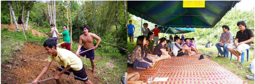
ภาพที่ 7 นักศึกษาจัดออกค่ายที่ อ.ท่าแซะ จ.ชุมพร

ครั้งหนึ่งเมื่อสิ้นสุดภาคการศึกษาแล้ว ปรากฏว่ามีนักศึกษาที่เคยลงเรียนในรายวิชาได้ชักชวนเพื่อนจัดออกค่ายในพื้นที่ที่เคยไปเรียนรู้เรื่องเกี่ยวกับการพัฒนาในอำเภอท่าแซะ จังหวัดชุมพร รวมถึงมีการสื่อสารกับชาวบ้านในพื้นที่อย่างต่อเนื่อง มีการทำกิจกรรมร่วมกับองค์กรพัฒนาเอกชน และเครือข่ายชาวบ้านในพื้นที่อื่น สำหรับกรณีเช่นนี้ชัดเจนว่าเป็นการขยับจากการเป็นผู้เรียนรู้ปรากฏการณ์ไปเป็นผู้เป็นส่วนหนึ่งของสถานการณ์ ถือว่าการเรียนรายวิชาสังคมวิทยาการพัฒนา ทะลุออกจากโลกวิชาการในห้องเรียนต้อยออกไปสู่การขับเคลื่อนในประเด็นสาธารณะโดยที่ผู้สอนมิได้คาดการณ์ไว้ล่วงหน้า